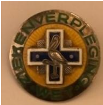
Insigne, geschonken door Anneke Looman (1931), een verpleegkundige met diploma's A en B, plus kraam-, kinder- en wijkaantekening

SHVB ontvangt geregeld schenkingen van belangstellenden en (oud-)verpleegkundigen. Bijzondere vermelding in 2020 verdient de schenking van het insigne van mevrouw A.C. Looman uit Dordrecht, die tussen 1956 en 1965 alle destijds bestaande verpleegkundige diploma's wist te behalen, zoals goed te zien op onderstaande foto.