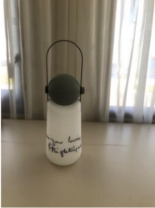
Weltevreë editie Lamp van Florence Nightingale (2021)

De SHVB is op 2 juni 1986 opgericht en in het verslagjaar werd haar 35-jarig jubileum gevierd. Dit vond plaats op Urk met een bijeenkomst bij de collectie en een lunch in visrestaurant De Kaap.